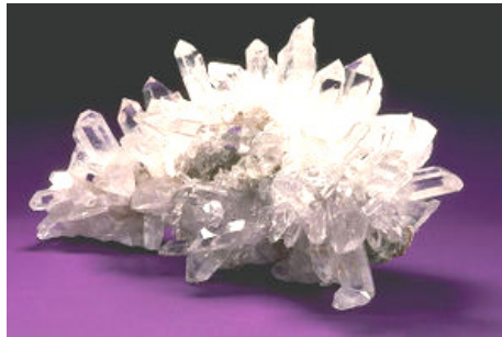
Reiner Quarz (Bergkristall)

.....kommt aus Spruce Pine, North Carolina und ist 99.98% Quarz Kristall (SiO 2 ). Die Klangpyramiden bestehen also aus reinstem Kristall (wie Bergkristall), nicht zu verwechseln mit Kristallglas ,welches aus mehreren Komponenten wie Blei, Soda, Natron und Kalk, besteht.